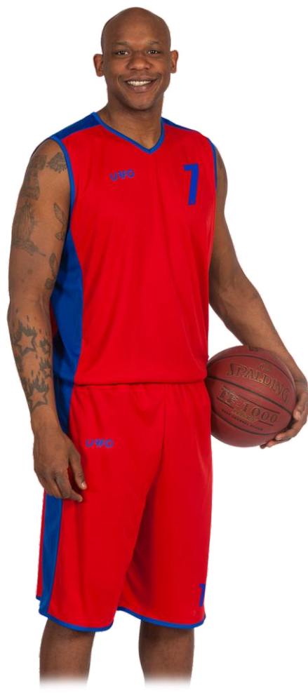
model ECONOMY 2