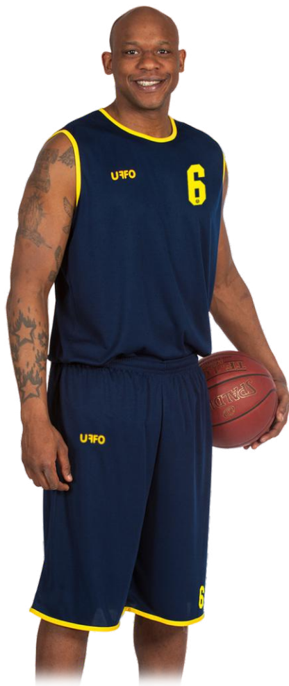
model ECONOMY 1